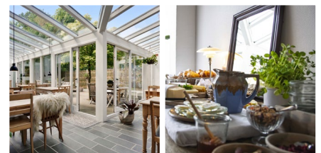
Hotel Aahøj, Sæby