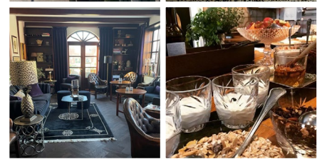
Park Hotel, Frederikshavn